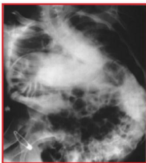
تصویر رادیولوژی همان فرد در ۲۳ سالگی

از سویی دیگر در بسیاری از موارد می‌توان با استفاده از تجهیزات معمول و با هزینه کم، فعالیت موردنظر مانند حرکت را برای فرد امکان‌پذیر نمود.