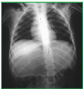
تصویر رادیولوژی از قفسه سینه کودک ۱۰ ساله مبتلا به فلج مغزی

بسیاری از این عزیزان به عوارض ثانویه ناشی از یک وسیله توان‌بخشی نادرست مبتلا می‌شوند.